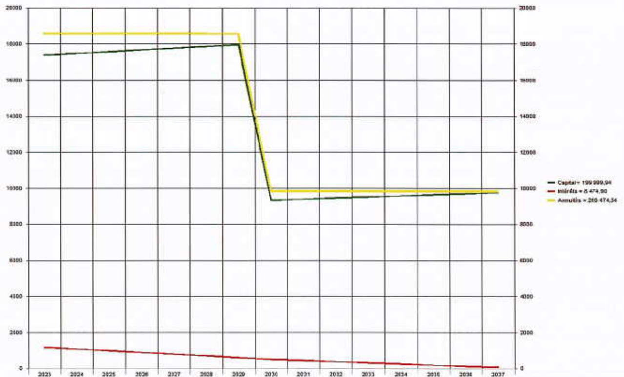
ÉTAT PRÉVISIONNEL DE LA DETTE - 22300 COMMUNE DE VILLERSFAUX

Accusé de réception - Ministère de l'Intérieur