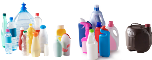
Bouteilles, bidons et flacons en plastiques