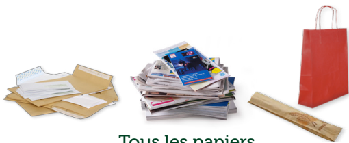
Tous les papiers