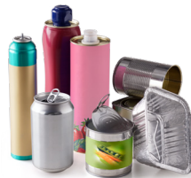
Barquettes, conserves, aérosols, canettes