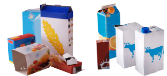
Tous les emballages en carton